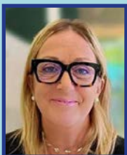
Mar Sicília Regidora de Comerç

Et convidem a gaudir de cada moment d'aquesta Festa Major i de la Fira Castrum Fidelis, a compartir l'emoció d'aquests dies i a continuar entfortint el sentiment d'orgull de la nostra ciutat.