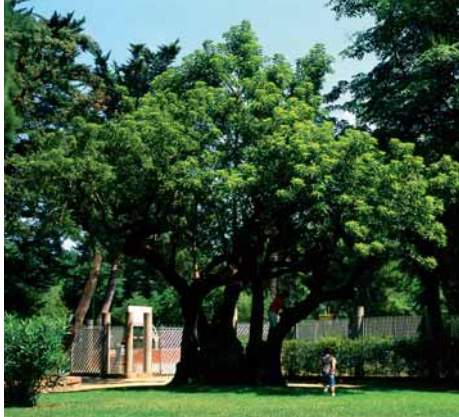
Bellaombra: "l'Arbre Pota Grossa"

Les bellaombres 1) , originàries d'Amèrica del Sud, són fàcils de reconèixer pel gran engruïment de la soca i les arrels que sobresurten del terra i arrenquen voreres i paviments. Nombroses i sinuoses branques formen una capçada protectora que ofereix una ombra densa i refrescant: d'aquí el seu nom. Les fulles són ovalades i les flors, uns bonics penjolls blancs, es transformen a l'estiu en petits fruits, agrupats en raïms. Viuen molts anys i malgrat el que indueix a pensar el seu aspecte, la fusta es trenca fàcilment i no serveix ni per a llenya.