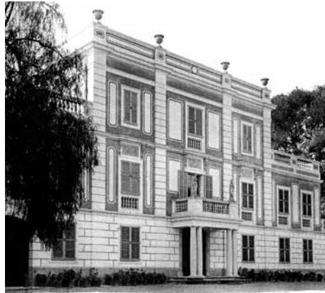
Un dels grans casals de Can Vidalet

Entre la segona meitat del segle XX i la guerra civil (1936-39), el sector d'Esplugues de Llobregat comprès entre el camí del Molí, la carretera general de Madrid a Barcelona i el límit amb l'Hospitalet, estava ocupat per conreus de secà i n'eren propietaris majoritaris les famílies Vidal, Jover i Juncadella, les quals residien en sumptuoses mansions envoltades de bells jardins, que milloraven i engrandien sovint. L'actual edifici de Can Vidalet és de les primeres dècades del segle XX.