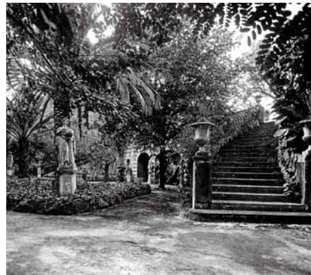
Antics jardins de Can Vidalet