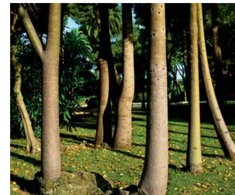
Troncs de braquiquitons

Al nord d'aquest sector destaca un grup de bellaombres molt grans. Els pins són tots pinyers, gairebé els únics del Parc d'aquesta espècie. Prop de les pistes de petanca hi ha una agrupació de còculs i una de braquiquitons, dues espècies d'origen exòtic.