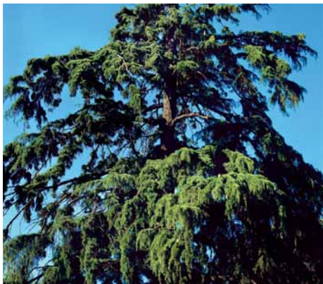
Cedre de l'Himàlaia

Limita pel nord amb el carrer de Laureà Miró, antiga carretera general; pel sud amb el carrer dels Cedres; a ponent amb el carrer del Molí, antic camí de carro que menava als camps, i a llevant amb una zona d'equipaments escolars i esportius, segregada del sòl previst inicialment com a parc.