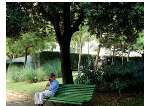
A l'ombra de l'alzina

utilitzat tradicionalment com a aliment del bestiar. La fusta, molt dura, és usada per fer eines agrícoles, pilons de carnisser, rodes de carro, etc. i fins ben entrat el segle xx per a l'obtenció de carbó.