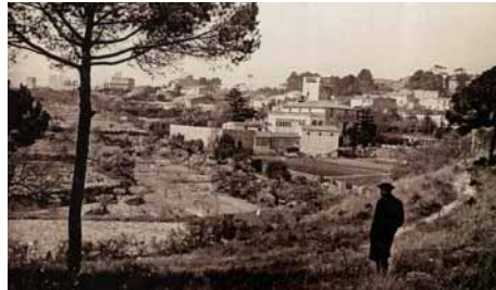
Torrent de Can Clota, anys 30