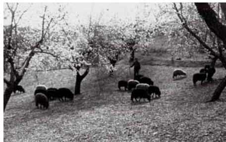
Paisatge d'ametllers, anys 20

A banda i banda del torrent, els dos barris, tenen el seu origen a principis del segle xx i deuen el seu nom a dues de les cases principals de cada sector. En aquells moments els conreus de secà predominaven en el paisatge (cereals, vinyes, garrofers, oliveres i ametllers) juntament amb alguns regadius (fruiters i horta), que aprofitaven l'aigua de mines, pous i torrents. En aquest marc s'anaven construint, a Can Clota i a Can Vidalet, casetes senzilles amb hortets i petits jardins. Els seus propietaris hi anaven a passar els dies de festa i pensaven en poder-s'hi retirar. Esplugues era, aleshores, un important centre d'estiuatge, amb una població total de 1.800 habitants l'any 1924.