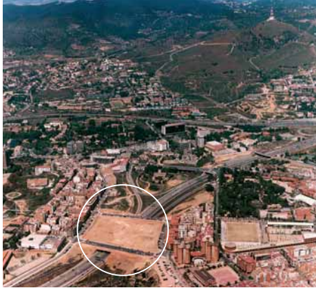
Inici de les obres del Parc, l'any 1995

El municipi d'Esplugues, al Baix Llobregat, s'estén vers el pla del Llobregat des dels contraforts de Collserola, al sector de Sant Pere Màrtir. Les aigües que baixen d'aquesta muntanya, cap al sud, han obert esvorancs en les terres d'al·livió de la part baixa del terme i han format, al llarg dels segles, els torrents que el travessen. Al sud de la carretera, entre els barris de Can Clota i de Can Vidalet, el parc de la Solidaritat és un pont verd que salta el torrent de Can Clota i la ronda de Dalt, unint dos barris històricament segregats i complint una important funció social com a element vertebrador d'un entorn urbà força disgregat.