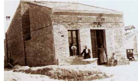
Una de les primeres cases del carrer d'Anselm Clavé l'any 1927 (L'edifici del darrere és el de l'antiga fàbrica del Sucre)

El barri de Can Clota, vora aquest mas, té l'espai limitat pels torrents de Can Clota i d'Esplugues, entre els quals es troba. Va néixer modestament als anys 30, en el camí de l'Hospitalet. També se l'ha conegut amb el nom del Sucre perquè al carrer d'Anselm Clavé hi havia una petita indústria, que empaquetava sucre de terrós per a bars i cafès. Pràcticament, el barri estava format per aquest carrer amb dues o tres travessies.